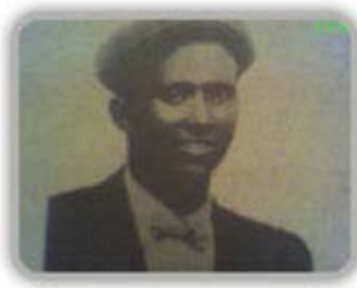
ምምባሳ ታህሳስ 2002 [Nov 2009]